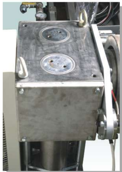
ツインシリンダー付油圧式スクリーンチェンジャー

コンベヤーで運ばれた廃プラスチックは、スチッタは取付てる回転刃で高速回転しながら粉碎します。