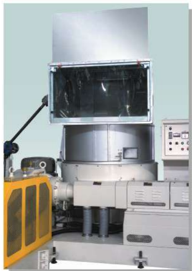
シュレッダードラム

コンベヤーで運ばれた廃プラスチックは、スチッタは取付てる回転刃で高速回転しながら粉碎します。