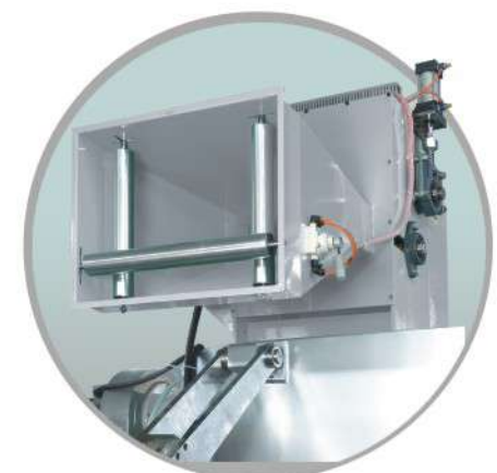
ニップロールフィーダー(選択)